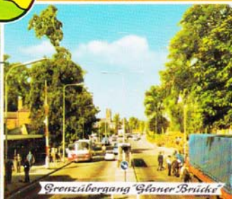
Grenzübergang 'Gloner Brücke'